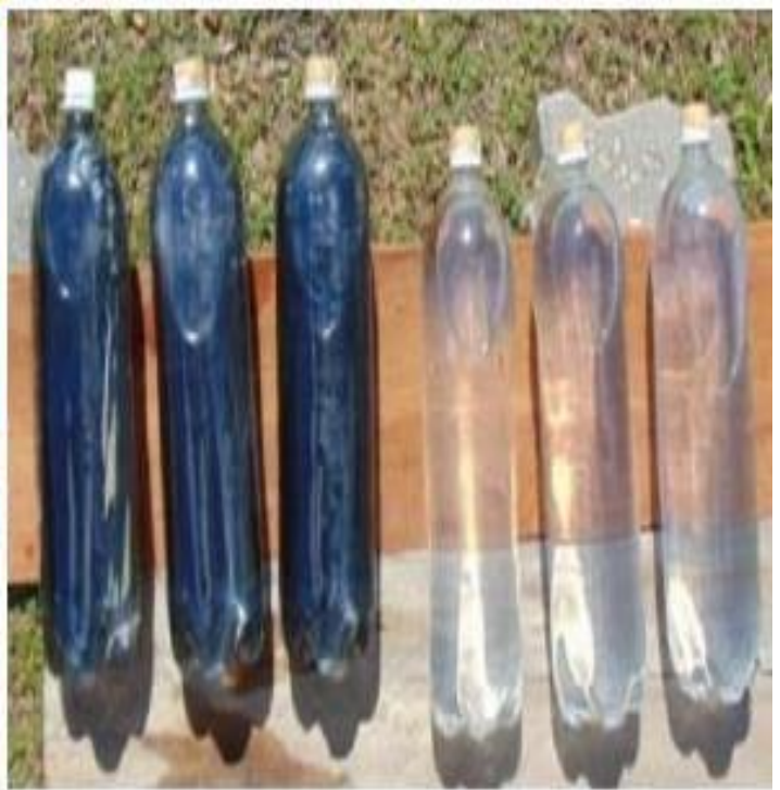
Figura 1: Experimentos de desinfecção solar de água de chuva: superfície de metal na imagem da esquerda e superfície de madeira na imagem da direita.