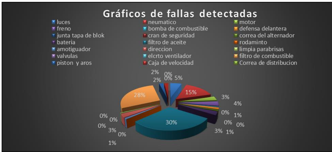
Figura 2: Promedio de disponibilidad por línea.