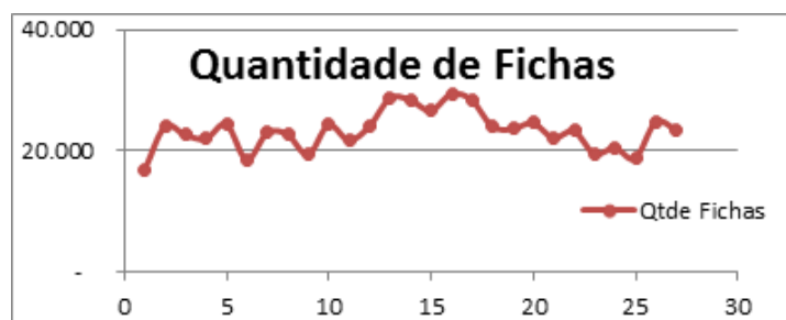
Figura 2: Quantidade de fichas por período.

Com os dados colhidos podemos, através de uma planilha eletrônica, organizar os dados e plotar a Figura 2. Dessa forma podemos verificar que a distribuição dos pontos no gráfico mostra claramente uma inclinação para o modelo de média móvel.